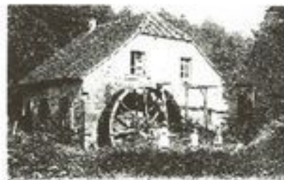
MOULIN BANAL DU BAS CLAIREGOUTTE, VALENTIGNEY

Ce moulin existait déjà au XV e siècle. Démoli pendant la guerre de trente ans, il fut reconstruit en 1635. Seul moulin à grain de Clairegoutte possédant une "ribe", c'est-à-dire une meule servant à broyer le chanvre pour en extraire la fibre, il a fonctionné jusqu'en 1840. Il existait d'autres moulins à Clairegoutte. Tous ont disparu.