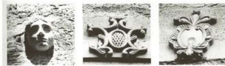
Les sculptures de la maison Thiebaut

Cette maison possède sur la façade côté verger une fenêtre surmontée d'une tête sculptée, et sur la façade côté ruisseau, deux fenêtres surmontées de deux médaillons sculptés.