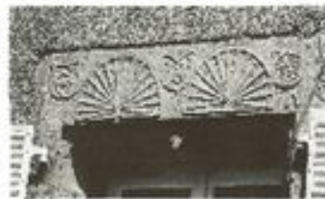
Armes du Wurtemberg et de Montbéliard ainsi que la salamandre de François Ier

Cette demeure fut celle d'un officier administratif du Prince de Montbéliard. Au-dessus d'une fenêtre sont sculptées les armes du Wurtemberg et de Montbéliard, ainsi que la salamandre de François Ier qui, du 28 juin 1534 au 3 mars 1535 fut non seulement roi de France, mais aussi comte de Montbéliard. La noblesse tenait une place importante à Clairegoutte. Citons Léopold de la Chaume d'Odelans, qui possédait un fief à Clairegoutte de 1649 à 1751. Il vécut certainement avec sa famille dans la maison Iselin-Sandeau.